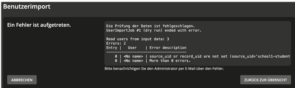
Abb. 1.6: Simulation hatte Fehler